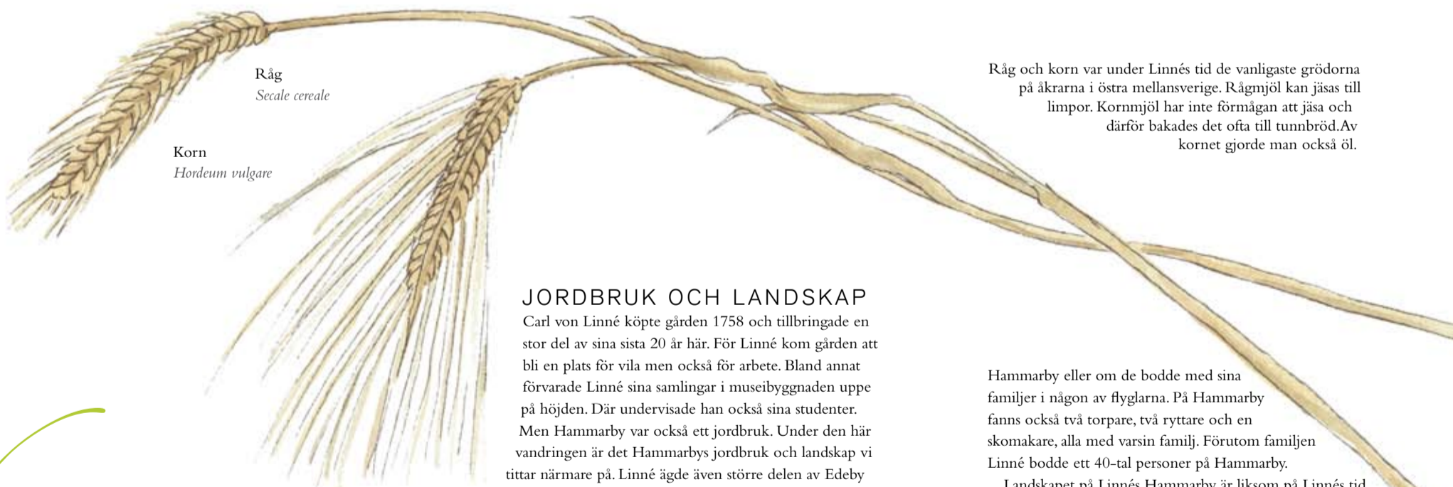
Råg Secale cereale